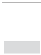
1/4 Seite quer